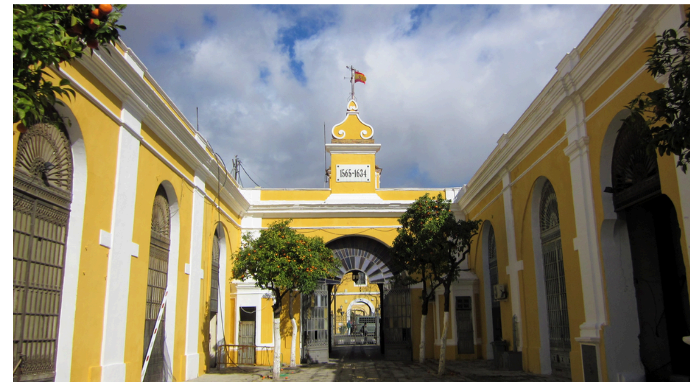
CONSULTORÍA REHABILITACIÓN PASSIVHAUS EN EDIFICIO HISTÓRICO - REAL FÁBRICA DE ARTILLERÍA SEVILLA: C&A

CONSULTORES Y DISEÑADORES PASSIVHAUS: CASTAÑO&ASOCIADOS 1º BLOQUE PLURIFAMILIAR PRECERTIFICADO PH EN ANDALUCÍA