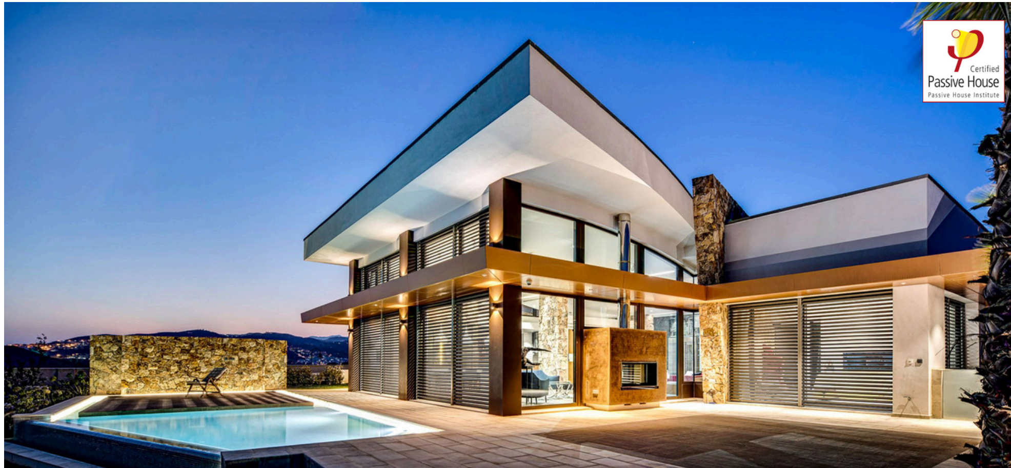
THE WAVE HOUSE (VILLA DE LUJO CERTIFICADA) Arquitectura: CACOPARDO Architects CONSULTORES Y DISEÑADORES PASSIVHAUS: CASTAÑO&ASOCIADOS PASSIVHAUS

Empresa de arquitectura, ingeniería, consultoría y formación especializada en edificaciones de consumo casi nulo bajo estándar Passivhaus. Con 40.000 m 2 realizados de consultoría Passivhaus . Especializados en edificios pasivos en climas cálidos . Además somos empresa de formación oficial acreditada por el PHI y la Plataforma PEP.