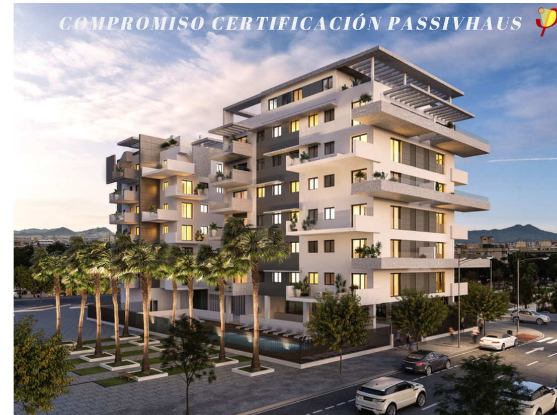
URBANLITORAL - PROMOCIÓN 44 VIVIENDAS | EXXACON Arquitectura: José Carlos Cifuentes Arquitectos JCCifuentes CONSULTORES Y DISEÑADORES PASSIVHAUS: CASTAÑO&ASOCIADOS 1º BLOQUE PLURIFAMILIAR PRECERTIFICADO PH EN ANDALUCÍA

Empresa de arquitectura, ingeniería, consultoría y formación especializada en edificaciones de consumo casi nulo bajo estándar Passivhaus. Con 40.000 m 2 realizados de consultoría Passivhaus . Especializados en edificios pasivos en climas cálidos . Además somos empresa de formación oficial acreditada por el PHI y la Plataforma PEP.